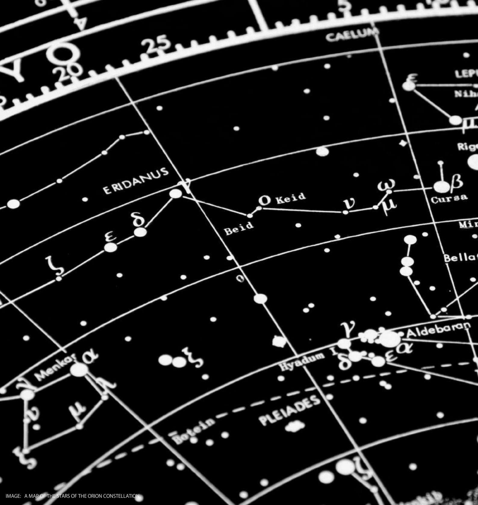
IMAGE: A MAP OF THE STARS OF THE ORION CONSTELLATION

Print ISSN: 2515-5784 Online ISSN: 2515-5792