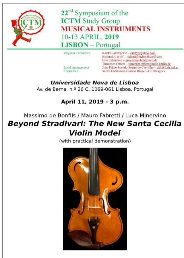
Fig. 1: Poster della presentazione del nuovo violino Santa Cecilia a Lisbona

Lungo gli anni abbiamo collaborato con varie Università nei Corsi di Ingegneria negli Strumenti Musicali (Università La Sapienza di Roma e l'Università Politecnica delle Marche ad Ancona). Nel 2016 abbiamo anche organizzato la prima edizione del Santa Cecilia Violin Making International Competition ove abbiamo accolto più di 100 strumenti partecipanti da 24 nazioni differenti. Due giurie hanno lavorato insieme, una di liutai e l'altra di concertisti, e la stampa nazionale ed internazionale ha mostrato grande interesse. Nell'ottobre del 2019 abbiamo anche aperto il nostro stand al World Music China Expo, a Shanghai. Inoltre abbiamo anche organizzato Seminari e Conferenze in varie Università e Conservatori Italiani. Abbiamo partecipato al 35th World Conference of the International Society for Music Education - ISME il 21 Luglio 2022 a Brisbane (video su YouTube https://youtu.be/G4zCumwgT_4 ), alla Conferenza Internazionale della European Platform for Artistic Research in Music - EPARM di Oporto (Portogallo, 2018), al